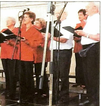
Der gemischte Chor der Chorvereinigung „Freundschaft“ Enzberg musizierte am Sonntag.