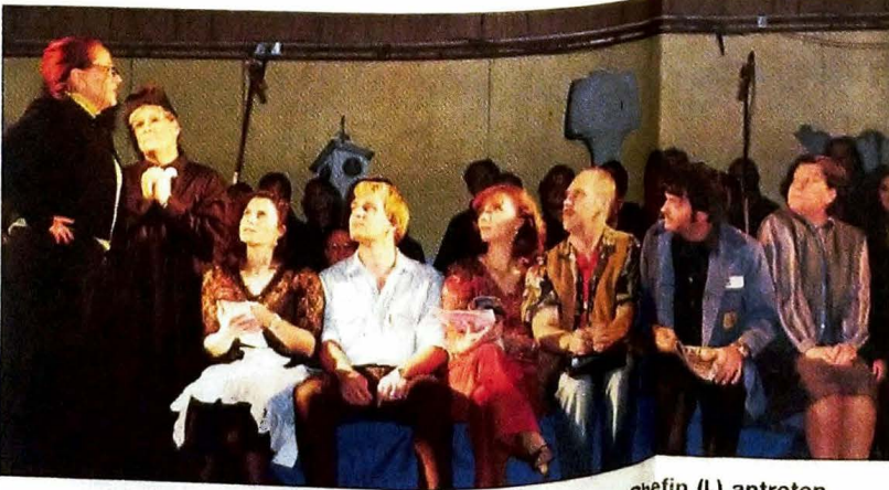
Die Crew von Blitzradio RTS muss bei ihrer generierten Chef (l.) antreten.

Und natürlich mussten für den perfekten Auftritt auch die technische Umsetzung, Maske und Bewirtung organisiert werden. An den beiden Aufführungsabenden waren auf und hinter der Bühne rund 70 Personen im Einsatz. Neben den üblichen Proben traf sich der Ton-Art-Chor auch zu einem Wochenende im Schloss Flehingen, wo nochmals intensiv an Liedern und Schauspiel gefeilt wurde.