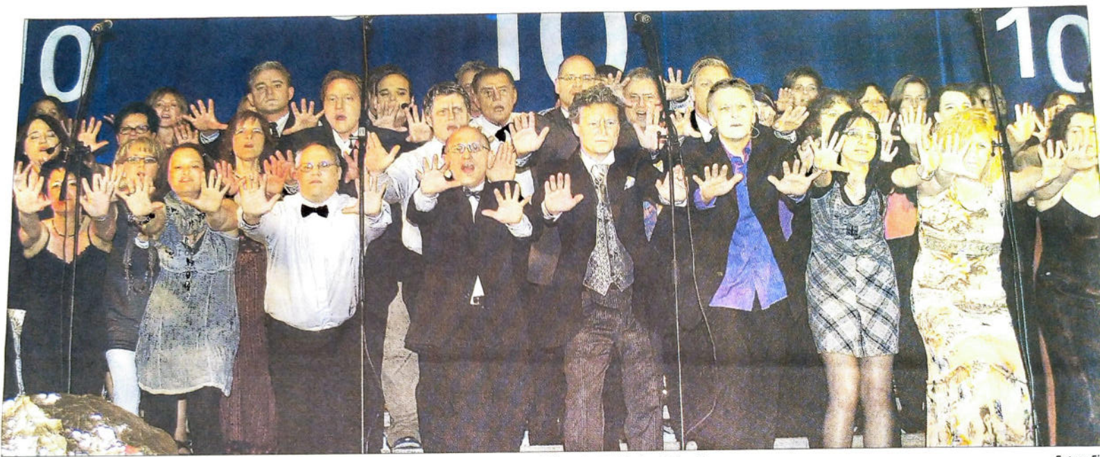
Das Beste aus zehn Jahren Ton-Art präsentieren die Sänger des jungen Chors ihrem begeisterten Publikum im Mühlacker Umlandbau.